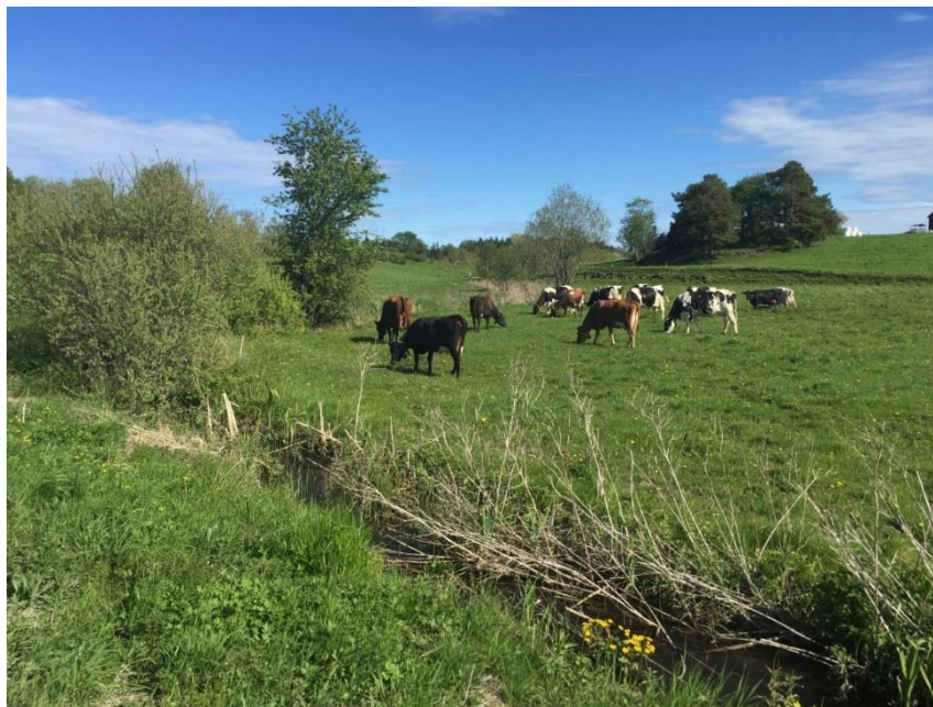
Mjölproduktion var gemensam för alla arrendatorer.